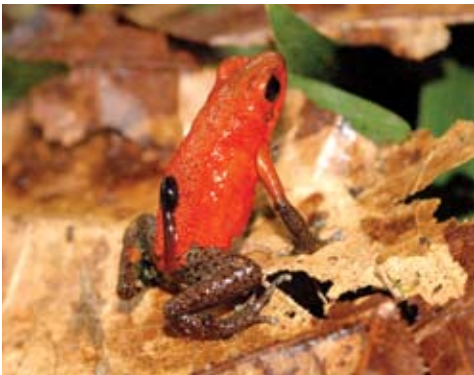
Oophaga pumilio . Esta rana roja venenosa habita bosques y cacaotales con y sin manejo. Se reproduce en la hojarasca. Cambia en una amplia gama de colores.