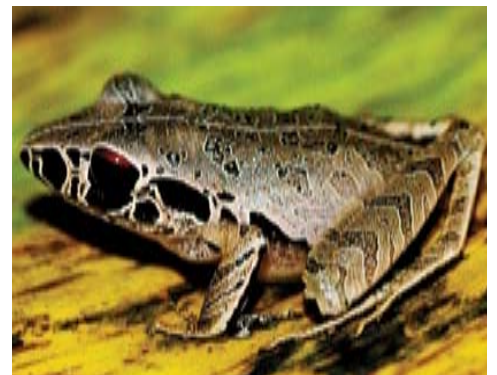
Craugastor gollmeri . Este sapo habita bosques y suelen esconderse bajo la hojarasca en donde deposita los huevos.