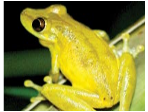
Scinax elaeochrous . Esta rana habita cacaotales con manejo. Suele verse sobre las hojas y los árboles. Se reproduce en estanques temporales de agua.