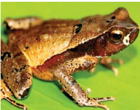
Rhaebo haematiticus . Este sapo habita el bosque y cacaotales. Los jóvenes suelen verse a lo largo de las quebradas bajo las rocas. Prefiere los estanques en sitios rocosos para reproducirse.