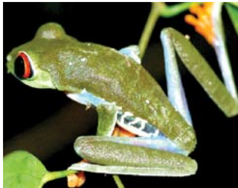
Agalychnis callydrias o rana de ojos rojos. Esta rana habita bosques y cacaotales. Se reproduce en estanques temporales o en pequeñas lagunas.