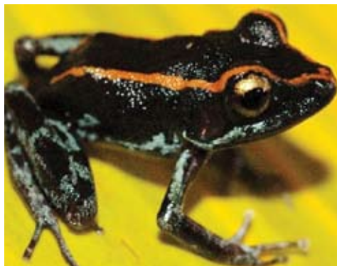
Pristimantis gaigeae . Esta rana habita los bosques y cacaotales. Los adultos suelen verse en la hojarasca del suelo y frecuentan pequeñas cuevas rocosas. Se reproducen en la hojarasca.