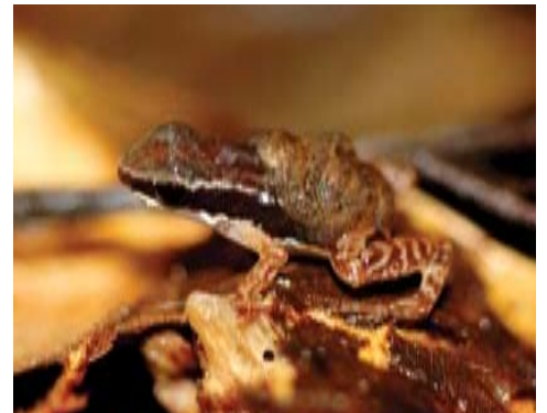
Colostethus pratti . Esta rana habita bosques y cacaotales. Suele verse en sitios rocosos cercanos a los arroyos. Se reproduce en la hojarasca.