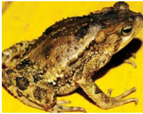
Cranopsis conifera . Este sapo habita en cacaotales con poco manejo. Puede verse encima del suelo sobre arbustos. Se reproduce en estanques.