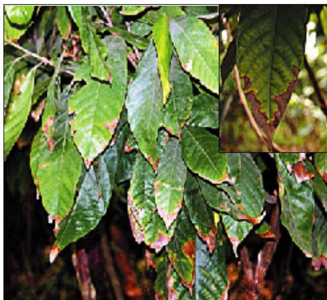
Foto 2. Síntomas de deficiencia de K en cacao.