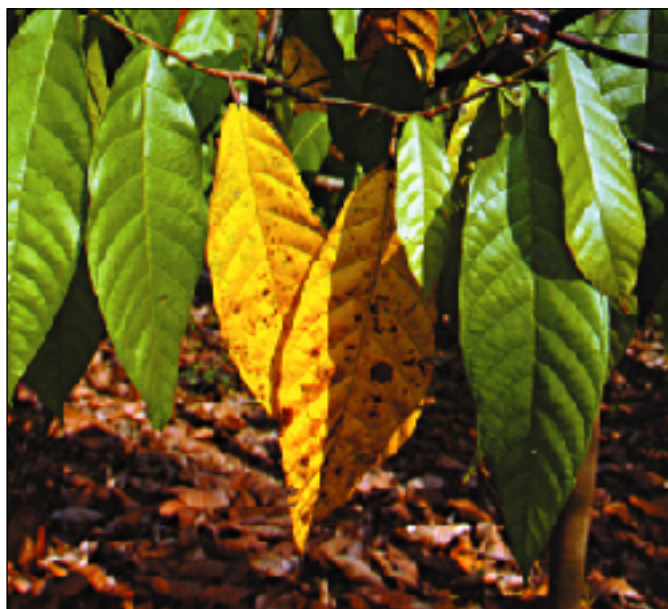
Foto 1. Síntomas deficiencia de N en cacao.